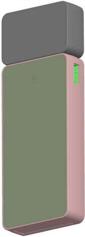
【视图名称】使用状态参考图1