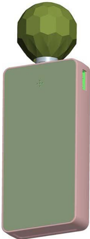
【视图名称】使用状态参考图2