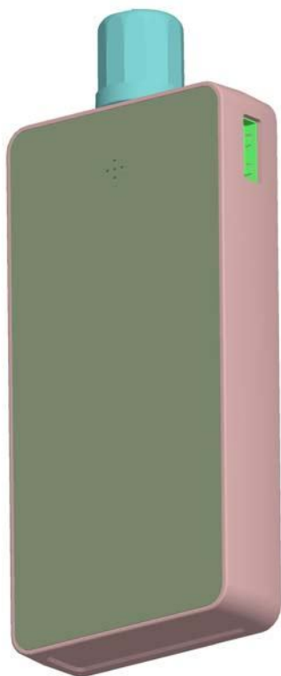
【视图名称】设计1 立体图